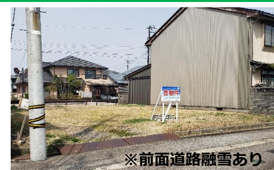
※前面道路融雪あり